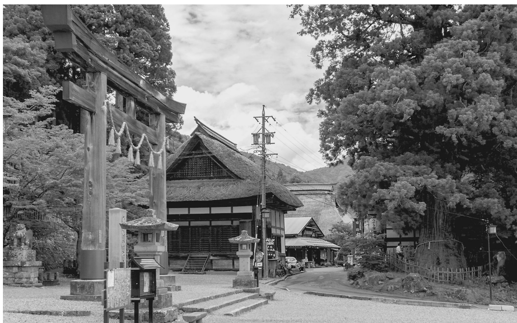
戸隠の町並み (国重要伝統的建造物群保存地区)