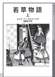
ルイザ・メイ・オルコット・作 海都 洋子・訳 岩波書店(岩波少年文庫)

次は、『若草物語』。原題は、Little Women「小さなご婦人たち」。「幼くてもひとりの人間として、自分に責任をもって生きよう」という父親の願いが込められています。1868年出版でアメリカの10代4人姉妹が描かれます。南北戦争に従軍して父親が留守の家庭で重なる苦難がおそいますが、それぞれ個性の異なる姉妹が協力し、