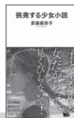
斎藤 美奈子・著 河出書房新社 (河出新書)

ここで、評論『挑発する少女小説』です。この本での「少女小説」とは、19世紀後半から20世紀前半に書かれた少女を主人公とした翻訳小説9作品を指し、ここで紹介する3作品も含まれています。21世紀の現在の視点からも根強い人気を誇る秘密に迫ります。その当時の時代背景に照らし合わせた著者の歯に衣着せぬ批判的な記述も新鮮です。主人公が自立するために奮闘する「シンデレラ物語の脱構築」は今も新しい。理不尽に対して率直に意見を言う戦う少女たち。この一冊は、原作をもう一度深く味わうきっかけとなるに違いありません。