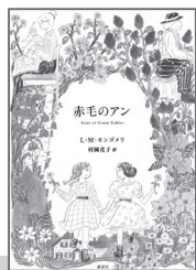
L・M・モンゴメリ・作 村岡 花子・訳 講談社

代表作といえば、初めに、『赤毛のアン』でしょう。カナダの自然に恵まれた片田舎を舞台に1908年に出版されました。孤児院から引き取られたアンは、当初奇異な目で見られ失敗を重ねますが、持ち前の並外れた想像力と賢明さで周囲の信頼を徐々に獲得していきます。彼女の夢想家ぶりに驚きますが、質素な暮らしの中での美しい自然が目に浮かびます。お気に入りの場所に次々と自分で考えた名前を付けていくのも素敵です。人前で有名な詩を語んじて朗読する場面もいいですね。