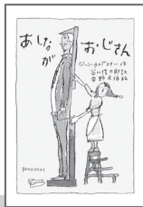
ジョン・ウェブスター・作 谷川 俊太郎・訳 安野 光雅・絵 朝日出版社

最後は、1912年にアメリカで出版された『あしながおじさん』です。孤児のジュディが匿名の篤志家あしながおじさんの援助により大学生活を送るお話。ジュディから篤志家への一方的な書簡形式で話が進み、女子学生の当時のキャンパスライフが描かれます。書簡では援助者に媚びない率直な言動に好感が持てます。途中から大学の奨学金を獲得したり、家庭教師のアルバイトをしたりして自立を目指す姿勢もかっこいいのです。